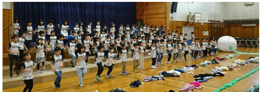
11月15日（水）学習発表会 児童公開

『学習発表会』には、早朝から多くの保護者等の皆様方にご参観していただき、ありがとうございました。また、子どもたちの活動の姿に、最後まで励ましの拍手や温かい声援をいただき、心から感謝申し上げます。