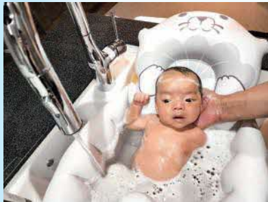
【タイトル】安全なお水で大好き？なお風呂 【ニックネーム】碧くん