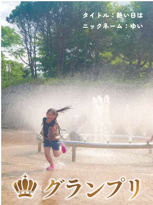
タイトル：暑い日は ニックネーム：ゆい