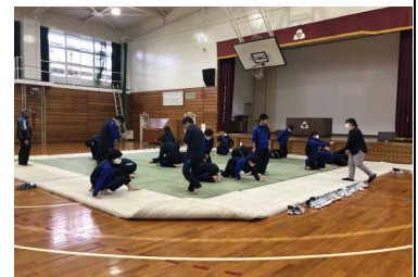
体育(柔道)のようす

授業や学級、部活動、友人との関係づくり等の生活に支障がなければまだ良いのですが、それらの特性が複雑に入り組み、授業についていけない、友人関係が上手くいかない、学校へ行けないなどの強い困り感として表出してくることも少なくありません。そのためにも、個々の特性を客観的に受け止め、特性に応じた対応の仕方を身に付けていくことが生きていく上で必要となってきます。