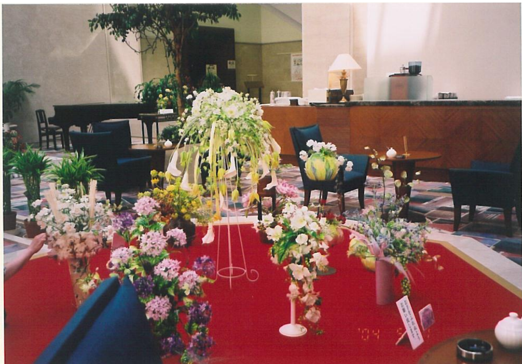
ホールを飾るアメリカンフラワー② (苫小牧市内のホテル)