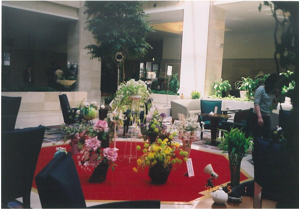
ホールを飾るアメリカンフラワー① (苫小牧市内のホテル)