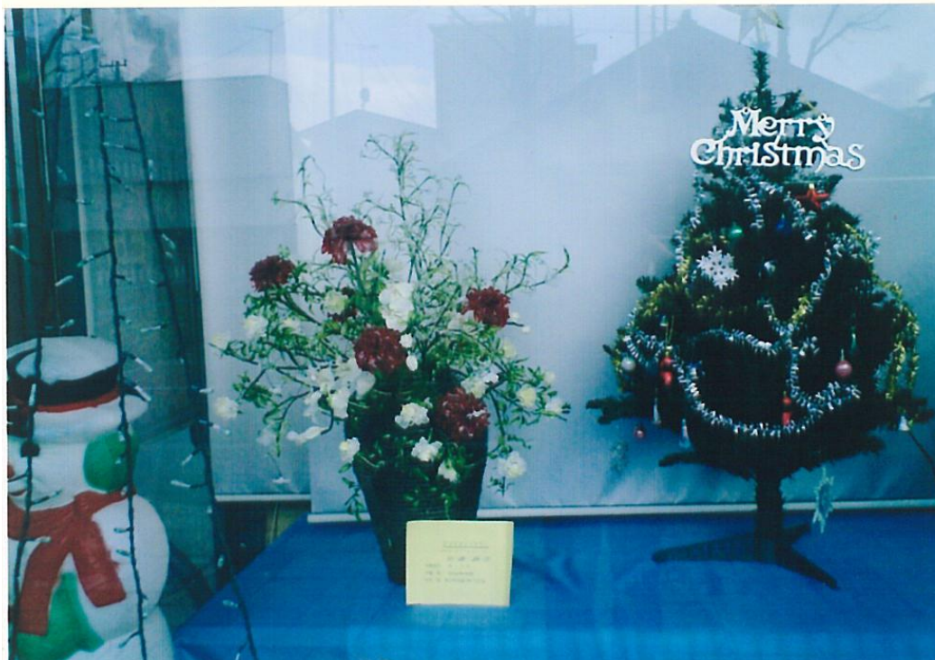
王子町のミュージアムでの展示④