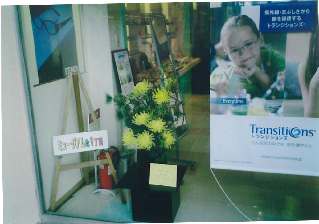
王子町のミュージアムでの展示①