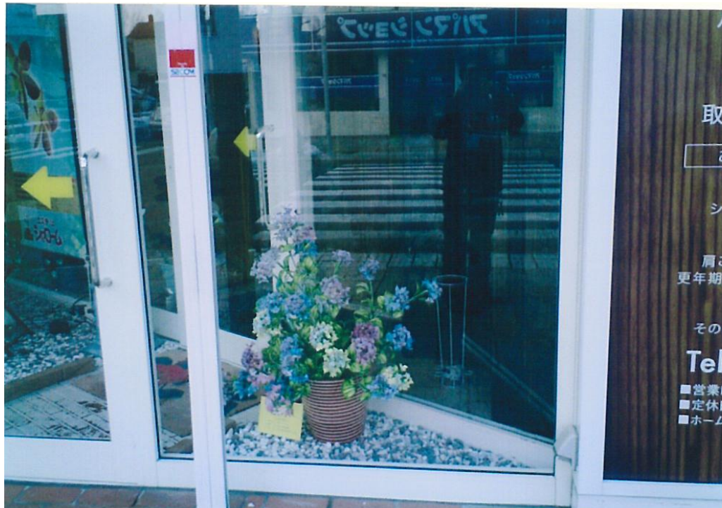
王子町のミュージアムでの展示②