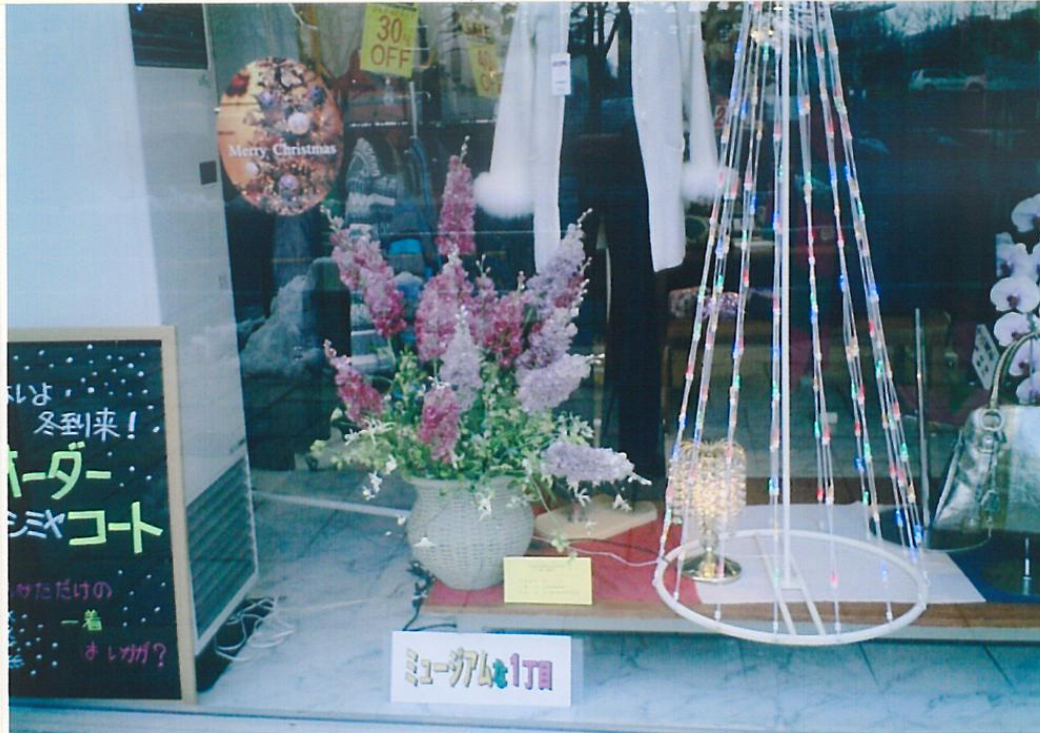
王子町のミュージアムでの展示③