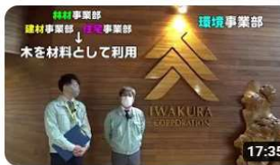
突撃！とまエコ企業 「イワクラ」編