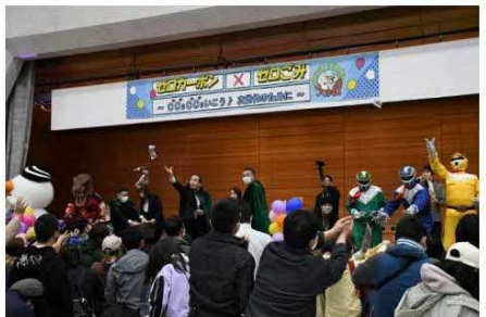
↑売り物にならないせんべいの端をリメイクして来場者へ配布！