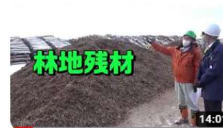
突撃！とまエコ企業 「苫小牧バイオマス発電」編