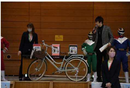
↑リサイクル自転車の無料抽選会も開催

◆エコカー×キッチンカーブース【エコカーからキッチンカーへ給電する様子を展示しました！】