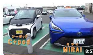
突撃！とまエコ企業～トヨタカローラ苫小牧編～