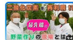
突撃！とまエコ企業「Jファーム」編