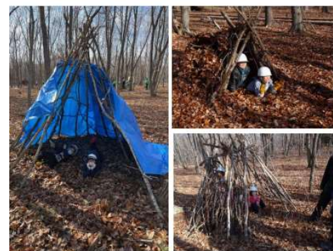
秘密基地完成！ 落ち葉の布団で中はとっても快適♪