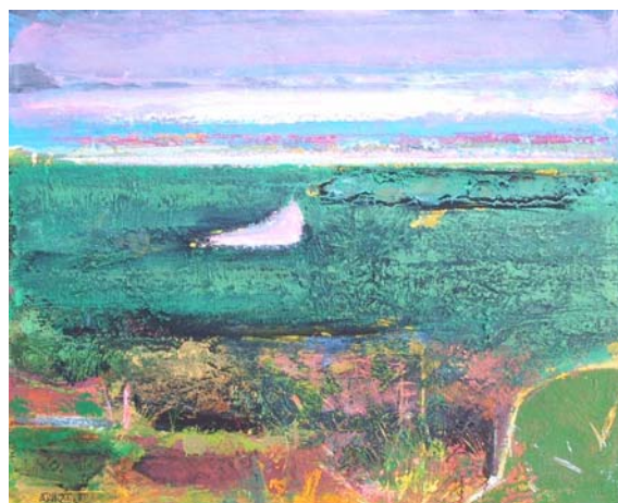
「勇払原野とウトナイ湖」1978年

黄、青、緑、ローズが多用され、画面はにわかにも明るくなり、形象はより単純化された。