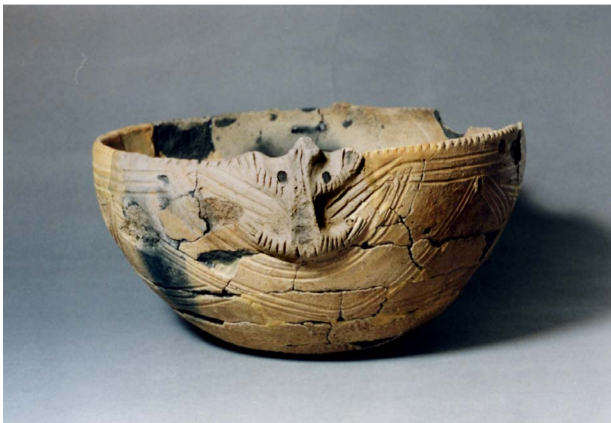
クマ意匠付土器（苫小牧市博物館蔵）