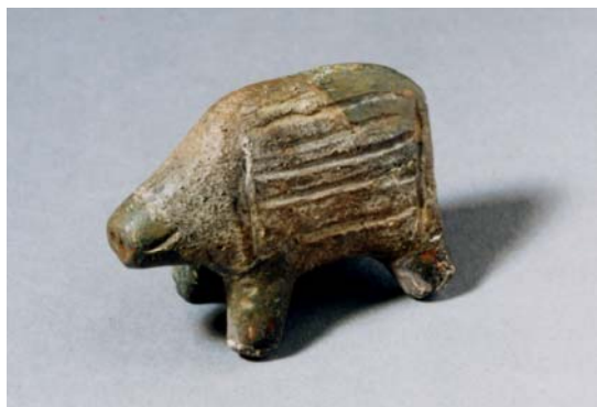
イノシシ形土製品（市立函館博物館蔵）