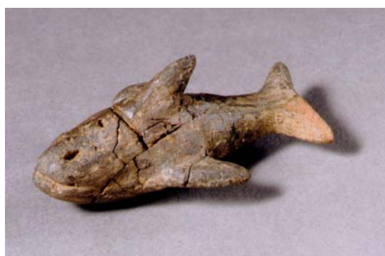
シャチ形土製品（市立函館博物館蔵）