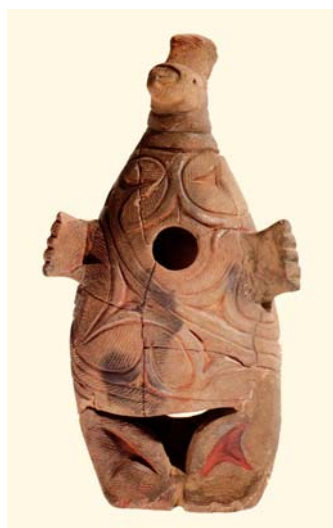
動物形土製品<複製> (千歳市教育委員会蔵)