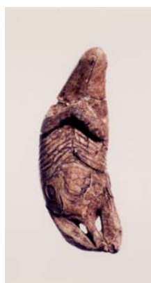
ラッコ形牙製品<複製> (北海道開拓記念館蔵)