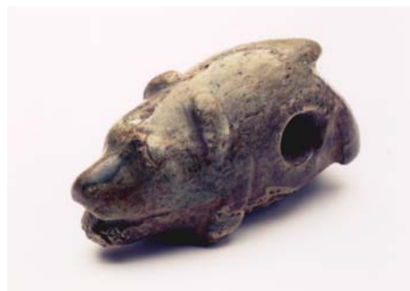
クマ形石製品<複製>（北海道埋蔵文化財センター蔵）