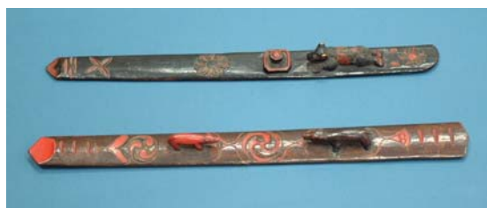
クマ意匠付棒酒箸（苫小牧市博物館蔵）

協力／網走市立博物館、虻田町教育委員会、江別市郷土資料館、上磯町教育委員会、釧路市埋蔵文化財調査センター、市立函館博物館、伊達市教育委員会、千歳市埋蔵文化財センター、常呂町教育委員会、北海道開拓記念館、(財)北海道埋蔵文化財センター