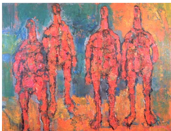
「北海の男たちII」1960年代前半