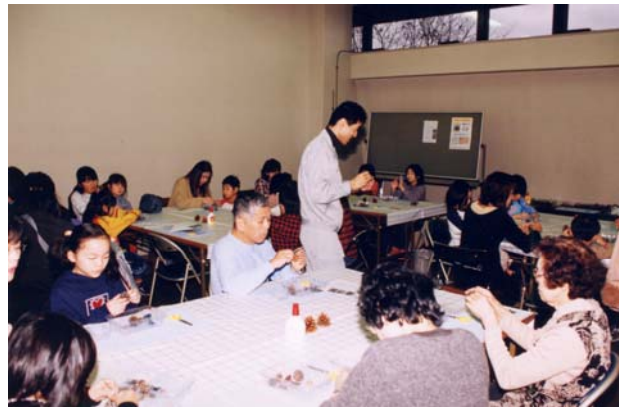
「木の実でつくろう」