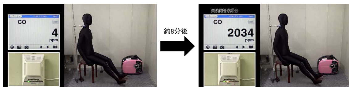
図2 室内で携帯発電機を使用した際の一酸化炭素中毒

当該製品に異常は認められず、換気が十分に行えない屋内で使用したため、排気ガスにより屋内の一酸化炭素濃度が上昇し、一酸化炭素中毒になったものと推定される。なお、本体及び取扱説明書には、「排気ガス中毒のおそれあり。」「屋内など換気の悪い場所で使用しない。」旨、記載されている。