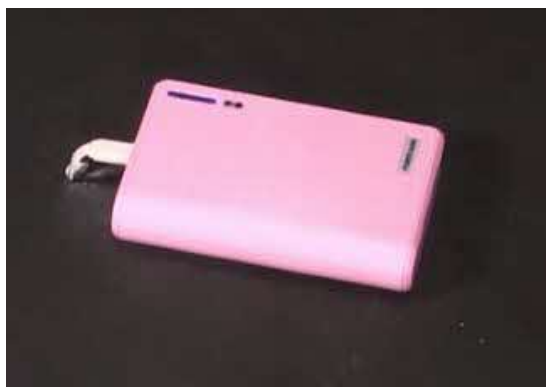
図4 モバイルバッテリーのイメージ

一方で、一定数の事故（火災）が毎年発生していますので、以下の注意点に従って、安全にご利用ください。