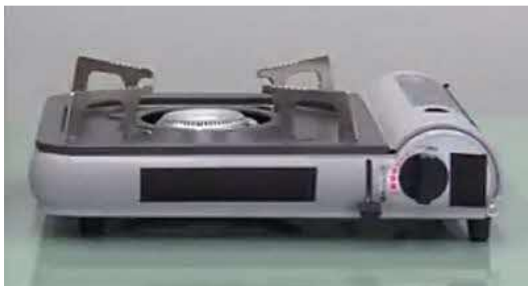
図3 カセットこんろのイメージ

しかし、カセットこんろの誤使用は、ボンベの破裂による火災など重大な事故につながる可能性もあります。以下の注意点に従って、安全にご利用ください。