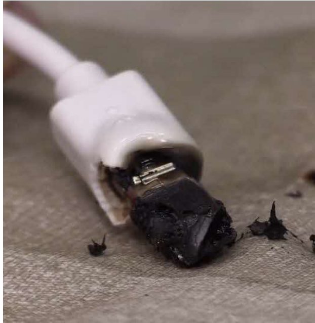
図5 焼損した充電ケーブルのコンネクタのイメージ