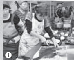
①贅沢にもまるごと使ったマツカワ料理教室

35cm以上という大きさが、繊細な味わいが特徴の魚です。癖のない白身ですので、焼いても揚げても美味しく、色んな料理で楽しめます。その中でも私のお勧めはお造りです。ほどよく脂も乗ってマツカワならではのプリっとした弾力や、上品な甘みを感じられます。 マツカワはたくさんの可能性を秘めた魚です。これから魅力を生かした調理法を研究し、もっと多くの人に美味しさを知ってもらいたいのです。ホッキ貝に続く「新しい苫小牧の顔」にしていきたいです。