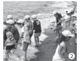
②体長4cmの稚魚放流。2年で35cmを超える大きさに成長する