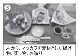
③マツカワ料理は北海道日本料理研究会苫小牧支部加盟店で食べられる 左から、マツカワを素材とした揚げ物、蒸し物、お造り