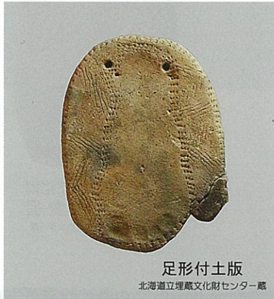
足形付土版 北海道立埋蔵文化財センター蔵

新千歳空港建設に伴う事前調査で、苫小牧市と千歳市の境界を流れる美沢川の流域に数多くの遺跡があることが分かりました。1976(昭和51)年から1995(平成7)年まで20年間続いた調査によって旧石器時代からアイヌ文化期までの膨大な資料が発見されています。本企画展では、その資料の中から国の重要文化財に指定されている動物形土製品やメカジキの線刻画のあるアイヌ文化期の權をはじめとして、土偶、縄文時代から擦文時代までの土器、集団墓地から発見された石棒やヒスイの飾玉、幼児の足形を付けた土版など、縄文文化の特質や精神性を表した資料を展示します。また、アイヌ文化を知る上で欠かすことのできない鉄製品や木製品などを展示し、縄文時代からアイヌ文化期までの様相の一端を紹介します。