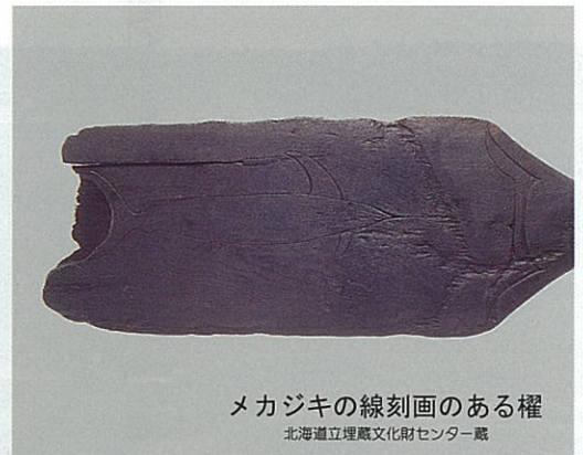
メカジキの線刻画のある權 北海道立埋蔵文化財センター蔵