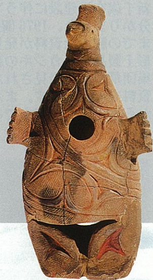
国指定重要文化財 動物形土製品 千歳市埋蔵文化財センター蔵