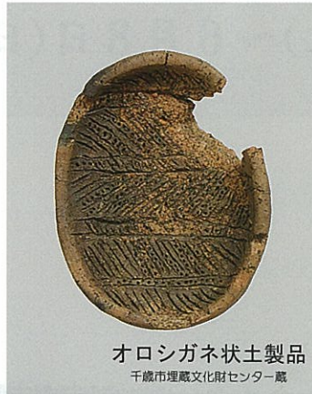
オロシガネ状土製品 千歳市埋蔵文化財センター蔵