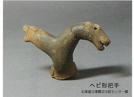
へび形把手 北海道立埋蔵文化財センター蔵