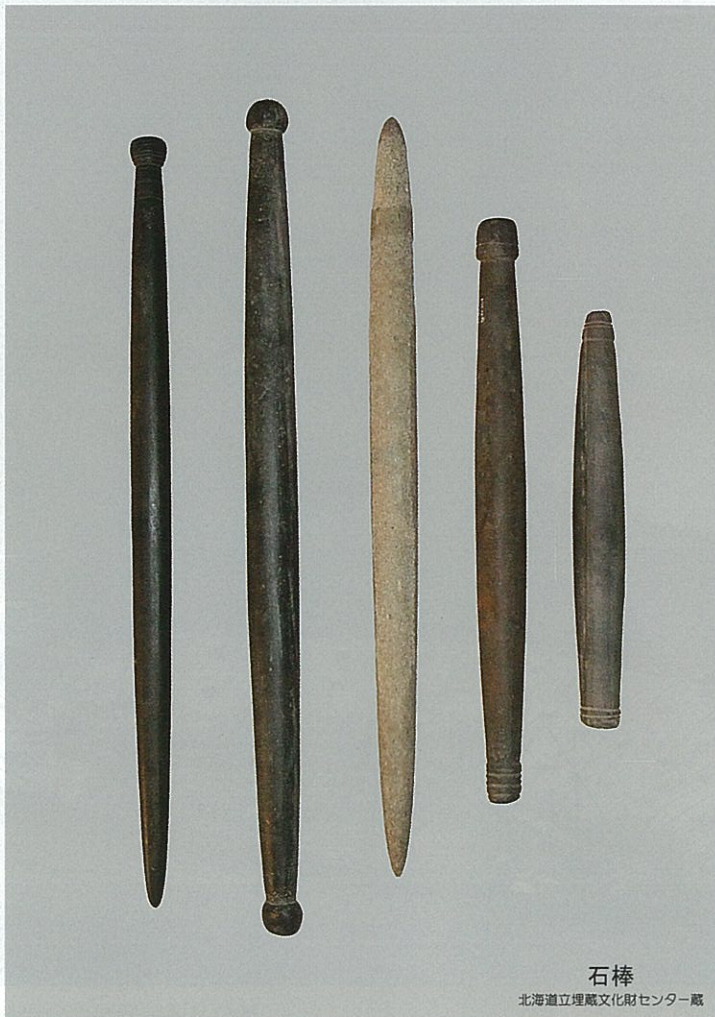
石棒 北海道立埋蔵文化財センター蔵