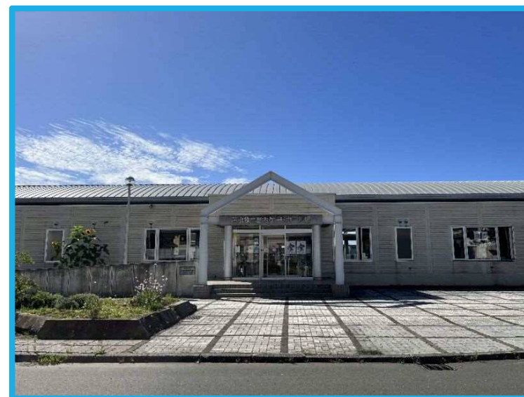
（屋内ゲートボール場外観）