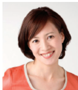
吉野 圭子 フリーアナウンサー (有限会社ボイスオブ サッポロ所属)