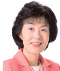
高橋 はるみ 北海道知事