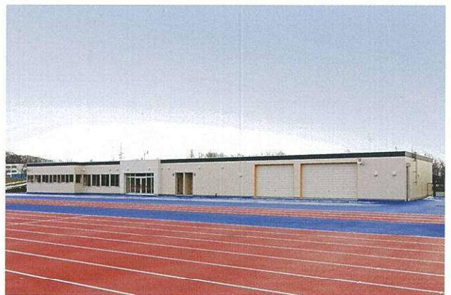
センターハウス競技場側