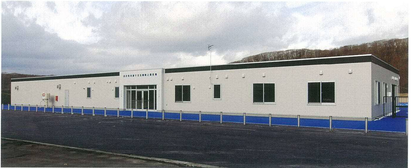
センターハウス正面