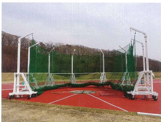
円盤・ハンマー囲い