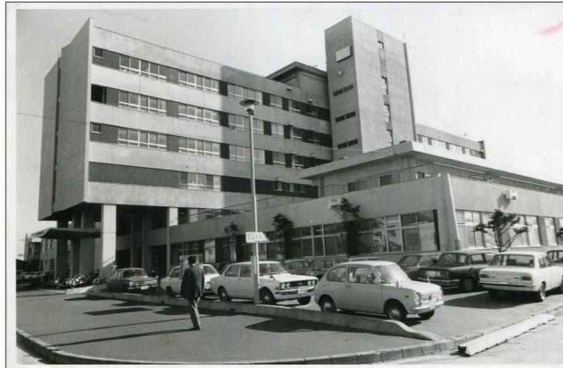
昭和43年完成 苫小牧市立総合病院

当院は今年で75年になります。そこで、当院の沿革を、懐かしい写真とともに簡単にご紹介します。 ※詳細な沿革は当院ホームページに掲載