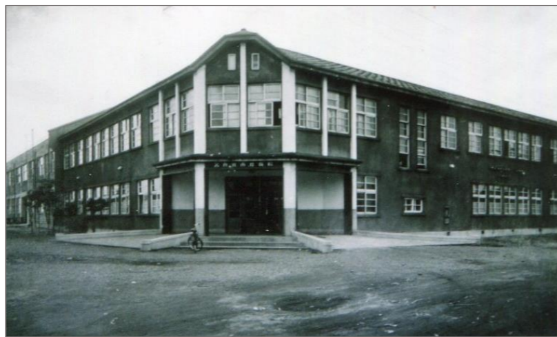
昭和27年完成 苫小牧市立保健病院