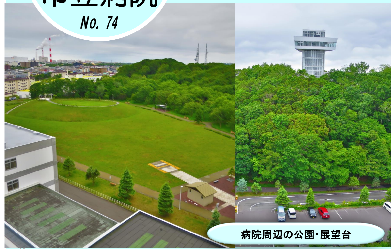
病院周辺の公園・展望台

マスク着用時に炎天下で過ごされる場合は、熱中症のリスクが高まりますので、こまめな水分補給など、熱中症に十分お気を付けください。