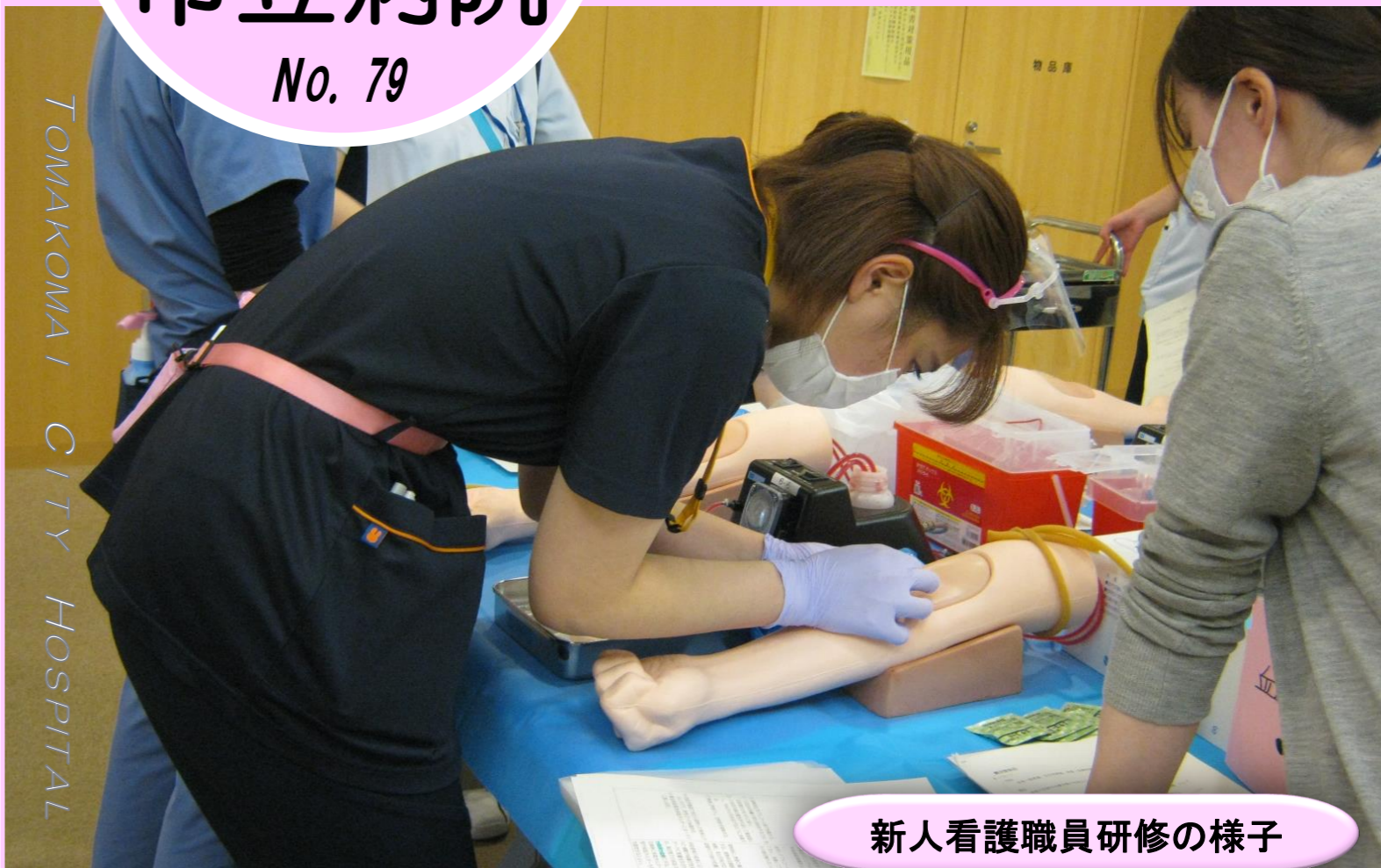
新人看護職員研修の様子

新年度を迎え、就職や異動などにより、新生活を迎えた方は、慣れない環境で疲れも出てくるとは思いますが、大型連休を迎えました。 だんだんと暖かくなり、イベントも多くなる時期ですが、感染対策を行い、事故やお身体に十分お気を付けください。