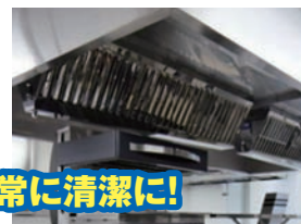
厨房設備は常に清潔に!

清掃、必要な点検及び整備など厨房設備の維持管理は「火災予防条例」で義務づけられています。