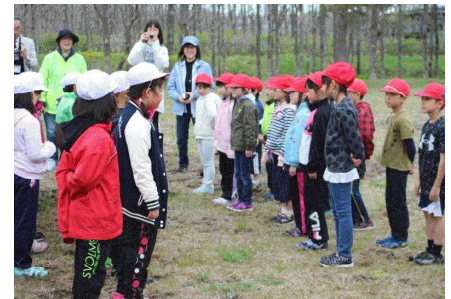
5月 遠足での学年交流