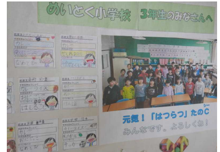
5月 自己紹介カード交換

さらに、閉校記念事業協賛会の事業として、6月の閉校記念大運動会では、とまチョップに参加・応援してもらい、一緒に「とまチョップ音頭」も踊って、子供たちも大喜びでした。7月には、閉校記念演劇鑑賞会として、劇団「風の子」による「めっきらもっきらどおんどん」を全校児童、保護者・地域の人と鑑賞しました。子供たちは、役者たちの熱演に引き込まれ、楽しい時間を過ごすことができました。