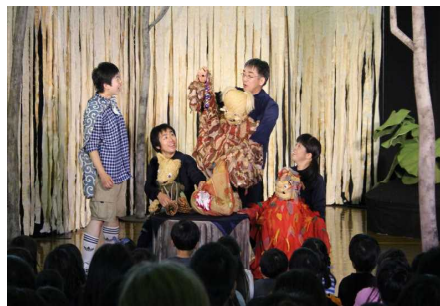
7月 閉校記念演劇鑑賞会