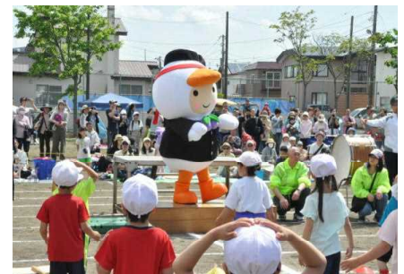
6月 閉校記念大運動会