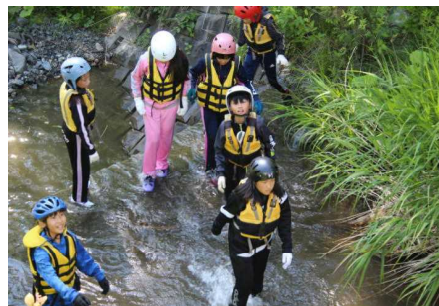
6月 宿泊学習での交流活動