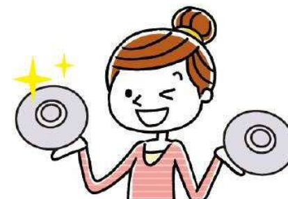
古くなったら交換