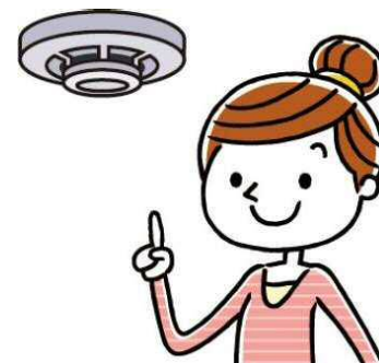
定期的な作動確認

作動確認をしても警報器に反応がなければ、本体の故障か電池切れです。（※2）警報器の本体又は電池を交換しましょう。