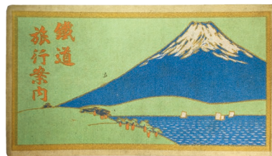
「鉄道旅行案内 初版」大正10(1921)年 吉田初三郎 当館蔵