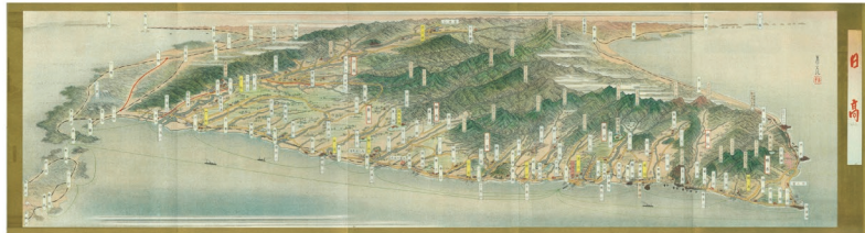
「日高鳥瞰図」昭和10(1935)年 金子常光 当館蔵