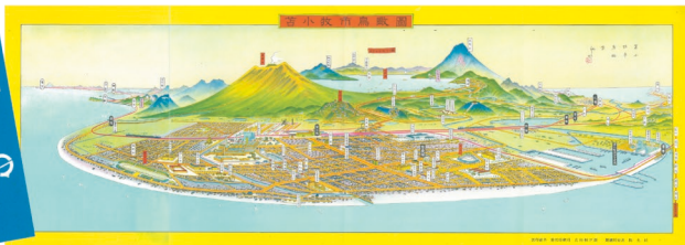
「苫小牧市鳥瞰図」昭和28(1953)年 吉田初三郎 当館蔵