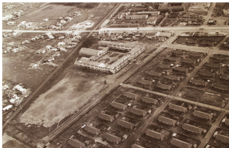
「王子製紙東部社宅上空から南東方向を望む」昭和37(1962)年