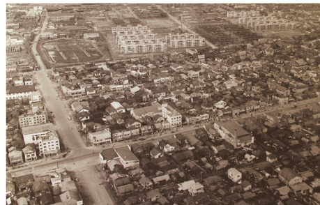
「寿町・本町・大町・錦町・王子町」昭和30年代 当館蔵