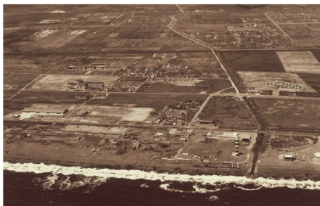
「糸井地区 現・大成町・新富町・光洋町」昭和40(1965)年 当館蔵