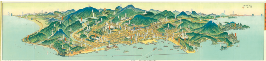
「小樽市鳥瞰図」昭和11(1936)年 吉田初三郎 北翔大学 水野研究室蔵