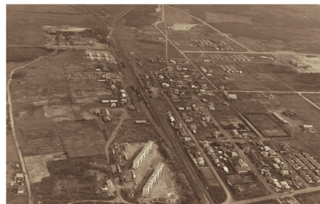
「沼ノ端」昭和40(1965)年 当館蔵