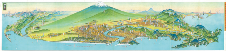
「富士を背景とせる沼津三島」昭和6(1931)年 吉田初三郎 北翔大学 水野研究室蔵