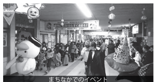
まちなかでのイベント