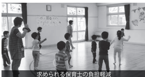
求められる保育士の負担軽減