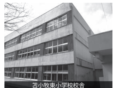
苫小牧東小学校校舎