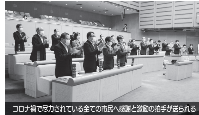
コロナ禍で尽力されている全ての市民へ感謝と激励の拍手が送られる

第7回定例会は6月11日から19日までの9日間の会期で、報告15件、議案28件、諮問1件、意見書案2件などの審議が行われました。開会に先立ち、新型コロナウイルス感染症拡大を防ぐために献身的な対応にご尽力されている医療・介護従事者の皆さまや、全ての市民の皆さまに対し、感謝と激励の拍手を送りました。今定例会で一般質問に登壇した議員は17名、主な内容として、新型コロナウイルス感染症の関連事項については多くの議員から現状や今後の対応について質問や議論がされました。その他に、教育行政、福祉行政、防災行政、環境行政などについて活発に質問や意見・要望が提案されました。新型コロナウイルス感染症による影響により、本市の経済および市民生活ならびに財政への影響が懸念されることから、市・事業者・市民が一丸となってこの難局を乗り越える意思を示す取り組みとして、令和2年7月の議員報酬月額を減額するための条例の一部改正を議員提案として提出、また、市長・副市長・教育長および常勤監査委員の令和2年7月の報酬月額を減額するための条例の一部改正が提出され、どちらも原案どおり可決されました。会期の後半には、各常任委員会・特別委員会が開催されました。