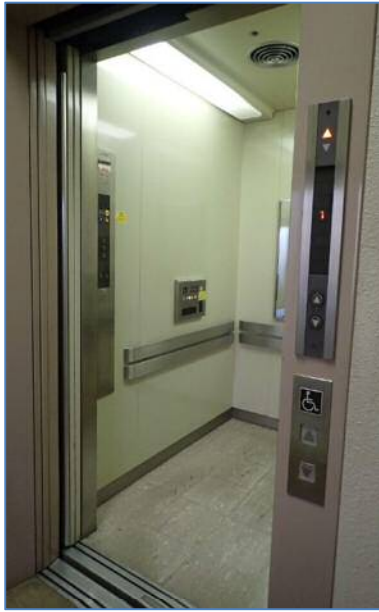
身障者対応エレベータ