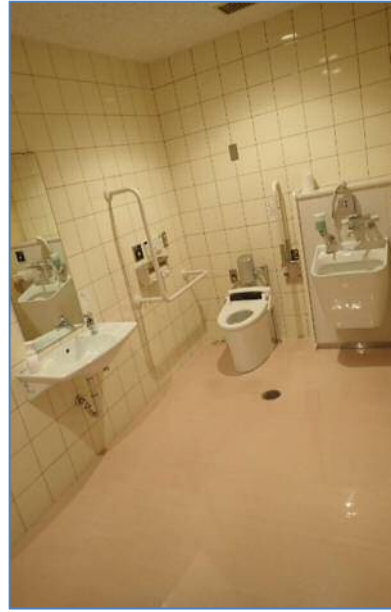
多目的トイレ (オストメイト対応)