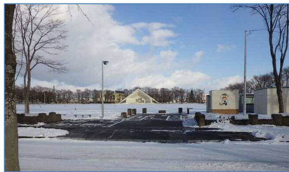
出入り口・身障者用駐車場（完成）