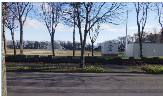
出入り口・身障者用駐車場（着工前）