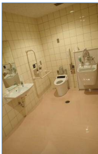
多目的トイレ（オストメイト対応）