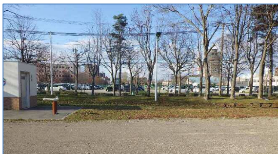
出入り口・身障者用駐車場（着工前）