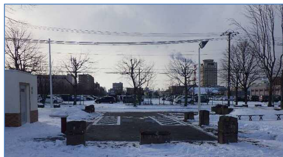
出入り口・身障者用駐車場（完成）