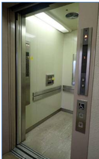
身障者対応エレベータ