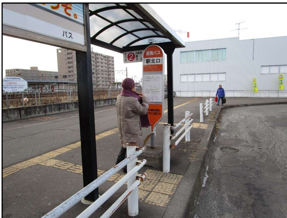
バス停留所標柱更新（駅北口）