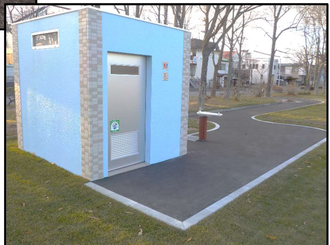
市民文化公園（出光カルチャーパーク）