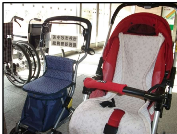
車いす等設置状況