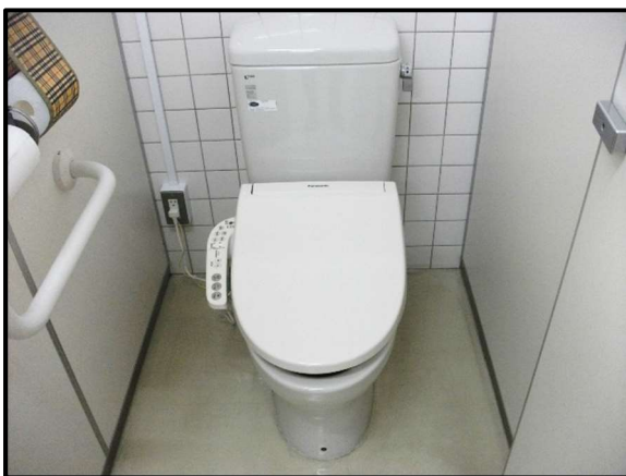
トイレの様式化、手すり設置