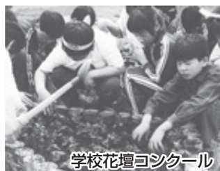
学校花壇コンクール