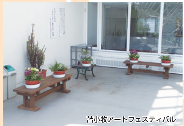
苫小牧アートフェスティバル