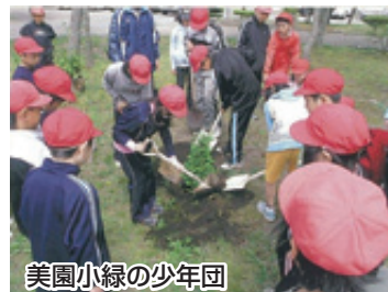
美園小緑の少年団

美園小学校緑の少年団活動行事として、校庭の樹木に名札50枚を付けながら身近にある木について学習した。