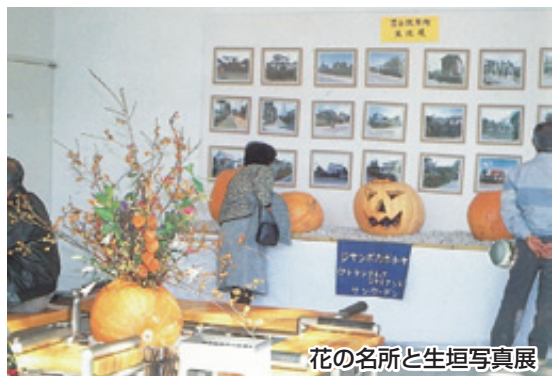
花の名所と生垣写真展