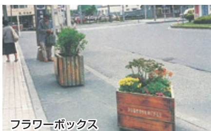
フラワーボックス

家の近くの街路樹の手入れ(簡単な剪定、植樹樹の除草、落ち葉の片付け、乾燥時の水やり、生垣の手入れなど)を市民の手で行い、愛情をもって引き継ぐために発足した。