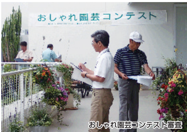
おしゃれ園芸コンテスト審査