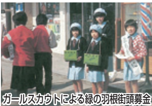
ガールスカウトによる緑の羽根街頭募金