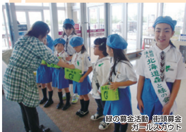
緑の募金活動 街頭募金 ガールスカウト