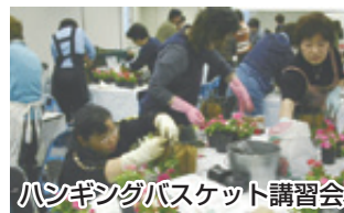
ハンギングバスケット講習会

ハンギングバスケットをガーデニングに取り入れて一般市民を対象に講習会を実施した。