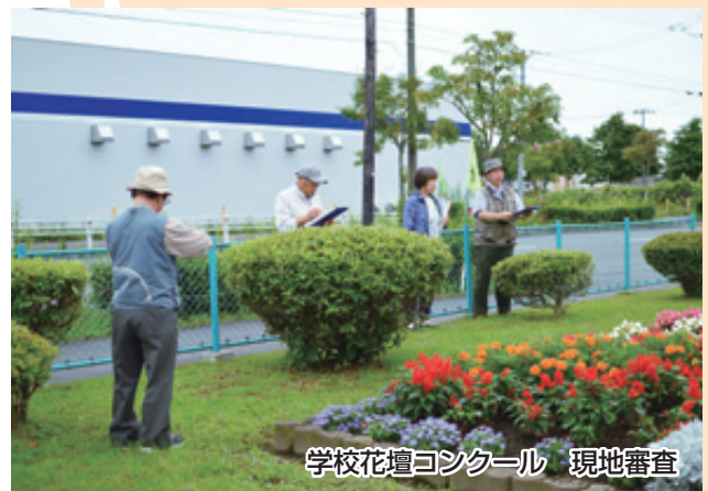
学校花壇コンクール 現地審査