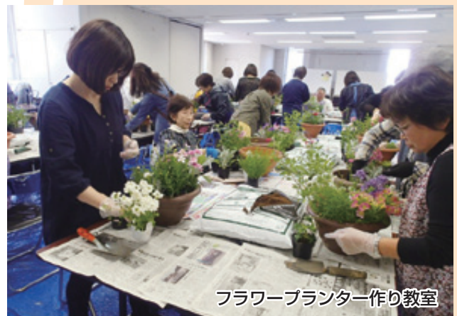
フラワープランター作り教室