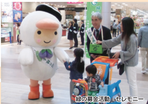
緑の募金活動 セレモニー