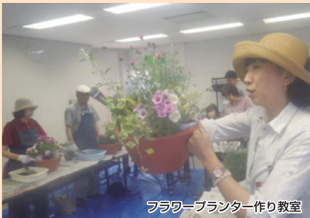
フラワープランター作り教室