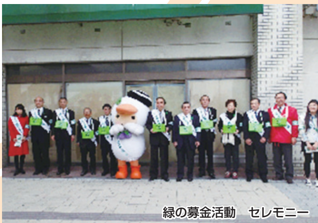
緑の募金活動 セレモニー