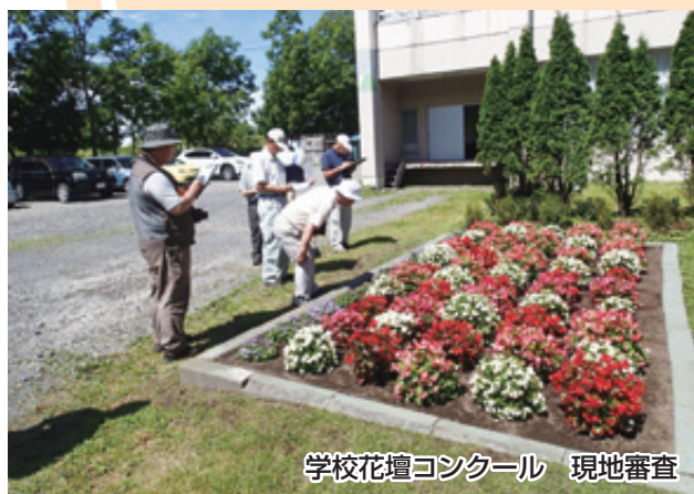
学校花壇コンクール 現地審査