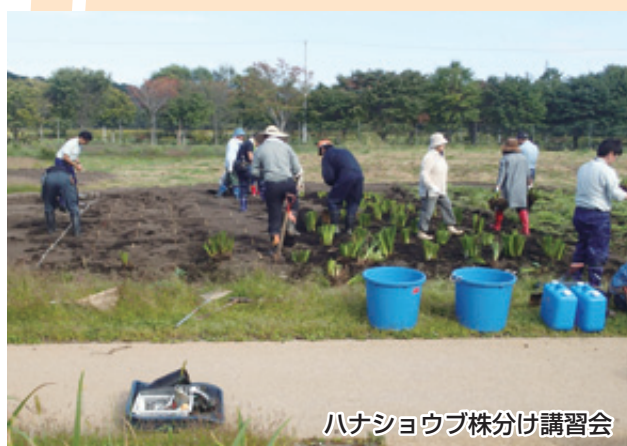
ハナショウブ株分け講習会