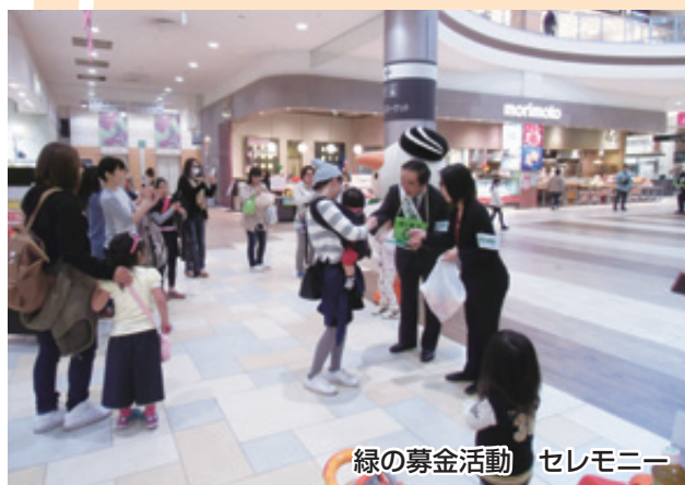
緑の募金活動 セレモニー