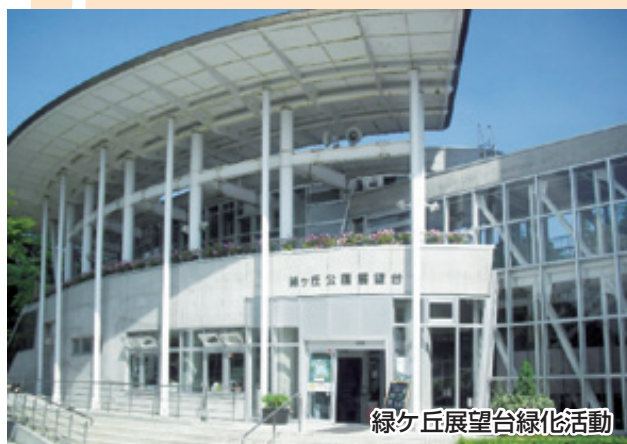
緑ヶ丘展望台緑化活動