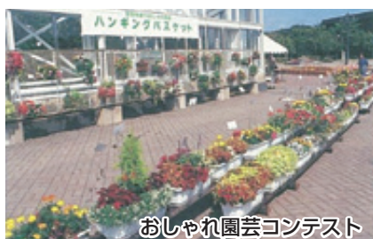
おしゃれ園芸コンテスト

花を用いて美しい快適な生活環境作りを推進する目的でコンテストを開催した。(ハンギングバスケット講習会で作成した作品と市民からの応募)