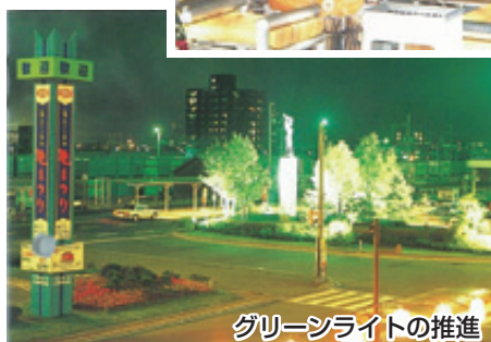
グリーンライトの推進