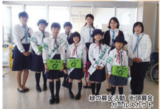
緑の募金活動 街頭募金 ガールスカウト