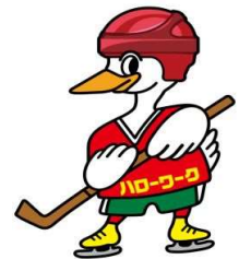
ハローワークとまこまい のマスコット“ワークくん”