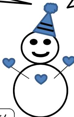
冬道プチ情報：膝をあげるように歩くと滑りにくいんだって！

部活動や塾の終了後等は、寄り道せず速やかに帰宅しよう！帰宅時刻を過ぎても、暗い中公園にいて指導員とお話したみんなもいましたね。みんな事件や事故に巻き込まれないよう無事に帰宅してほしいです。