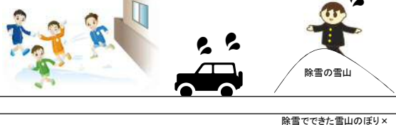
除雪でできた雪山のぼり×