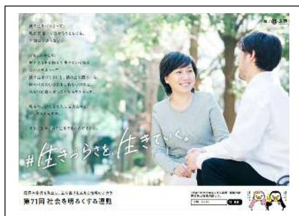
(内閣総理大臣メッセージ)