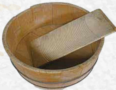
洗濯たらいと洗濯板 昭和時代