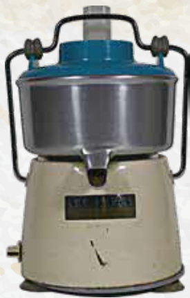
ジューサー 昭和中期

私たちの暮らしはどのように変わってきたのでしょうか。この展覧会では、昭和時代の生活道具の移り変わりから、暮らしの変化をふりかえります。水に関する道具を中心に、「あらう」「よそおう」「たべる」「たのしむ」などのテーマに分けてご紹介します。