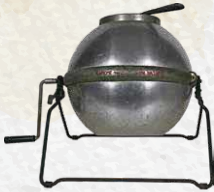
カモメホーム洗濯機 昭和32(1957)年製