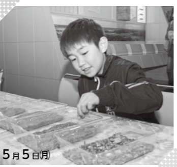
あみゅーで過ごす じゅせいの日