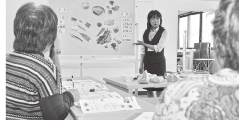
▲ヘルシーサポート(特定保健指導)での栄養指導の様子

昨年、特定健診と特定保健指導を受け、食生活の改善と運動を継続し、半年間でマイナス6.5kg、腹囲マイナス8cmを達成。現在も健康管理を続けている。69歳。