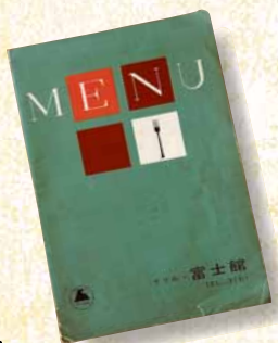
Grill富士館のメニュー