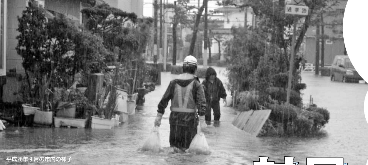
平成26年9月の市内の様子