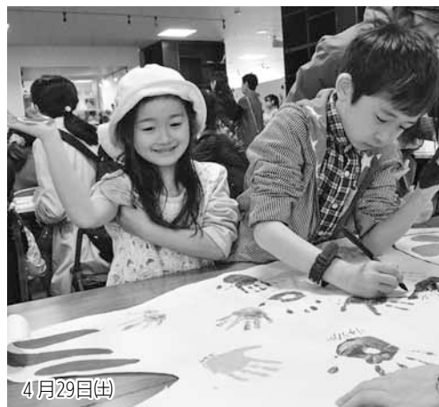
表紙から こども縁日

こどもの日に先駆けて、COCOTOMAでこども縁日が開催されました。会場では製作体験で巨大こいのぼり作り！模造紙で作った大きなこいのぼりに子どもたちは自分の手形を豪快に押しつけていました。他にもミニチュア屋台やステイジイベントなどのたくさんの催しが行われていました。