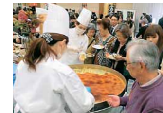
【苫小牧商工会議所】 東胆振地産地食フェアinとまこまい