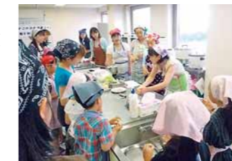
【北海道栄養士会苫小牧支部】 栄養士、市民を対象とした活動