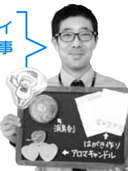
研究所のスタッフ

今年は新たな研究テーマが仲間入り。リサイクル体験を通して、資源の大切さや物を大事にする心を学びましょう！