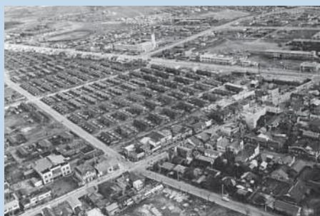
空撮写真「王子製紙中部社宅上空から南東方向を望む」 1962(昭和37)年撮影 旧志方写真工芸社撮影 美術博物館蔵