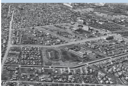
空撮写真「旭町」 1967(昭和42)年4月19日撮影

今から58年前の現在の錦町・表町・若草町・旭町を空から写した写真です。東西に横切る国道36号と2条通に挟まれるように王子製紙の東部社宅が軒を連ねています。左上には市役所の旧庁舎、現在の市総合体育館の場所には市営球場が見えます。一方、錦町と表町を分かち駅前通に面して、王子娯楽場や鶴丸デパートなど、あの時代を知る苦小牧っ子にとって懐かしい建物を見ることが出来ます。