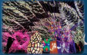
※写真は昨年のもので

開催期間 12月1日(火)〜2021年2月14日(日) 点灯時間 16:00〜23:00 ※2021年2月1日(日)からは17:00より点灯 場所 JR苫小牧駅南口・駅前広場 詳細はとまイル公式HP(https://toma-illu.com/)やSNSをチェック!