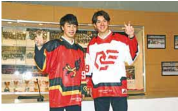
▲新ユニホーム発表記者会見の様子

本格始動はこれから。アイスホッケータウン苦小牧でその魅力を存分に発揮できるように、新体制のチャレンジに注目が集まります。