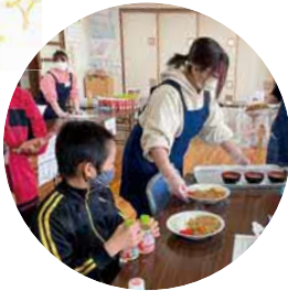
▲5月1日、1回目の子ども食堂の様子