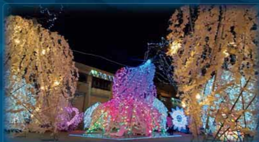
※写真は昨年度の様子