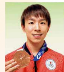
にわ こうき 丹羽 孝希 さん

学術、芸術、スポーツ、文化などの分野で優秀な成績を残すなど普及に尽力され、郷土に貢献した方の功績をたたえるものです。