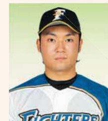
いとう ひろみ 伊藤 大海 さん

野球日本代表として、東京2020オリンピックに出場し、金メダルを獲得。チームでは唯一のオリンピック経験者として、侍ジャパンのメダル獲得に貢献。