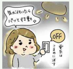
絵:アトリエなちこ