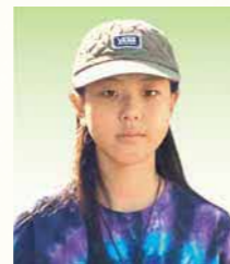
ひらき こな 開心那 さん

野球日本代表として、東京2020オリンピックに出場し、金メダルを獲得。本大会では3試合に登板し、侍ジャパンのメダル獲得に貢献。