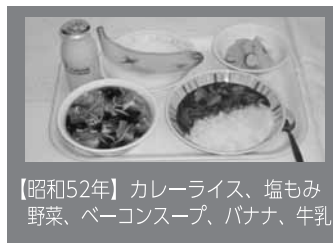
【昭和52年】カレーライス、塩もみ野菜、ベーコンスープ、バナナ、牛乳