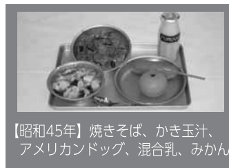
【昭和45年】焼きそば、かき玉汁、アメリカンドッグ、混合乳、みかん