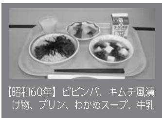
【昭和60年】ビビンバ、キムチ漬物、プリン、わかめスープ、牛乳

海外への食料依存や、食の安全に対する意識の高まりなど、あたりまえのことですが「安全な食べものを安心して食べる」ことがとても大切になってきています。学校給食の現場でも、安全を守るために、産地のわかる食材を仕入れ、納品食材の検査を入念に行っています。また、異物混入や食中毒を起こさないように細心の注意を払い、衛生上の管理を徹底しています。特に、今年4月にオープンした第1学校共同給食調理場は、最新の設備を備えた「安全・安心」に配慮した調理場となっています。