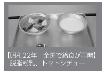
【昭和22年 全国で給食が再開】脱脂粉乳、トマトシチュー