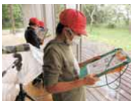
館内クイズラリーの様子