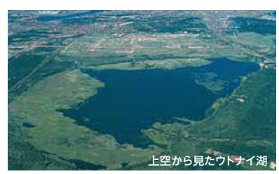
上空から見たウトナイ湖