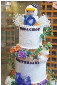
▲市役所ロビーにある「とまチョップ生誕10周年記念ケーキ」

現在作家としての活動は、オーダー受注や市内外で開くワークショップが中心です。「苫小牧で創作活動ができる民泊を開くのが夢になりました」。夢を形に近づけるため、これからも活動は続きます。