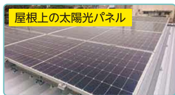
屋根上の太陽光パネル