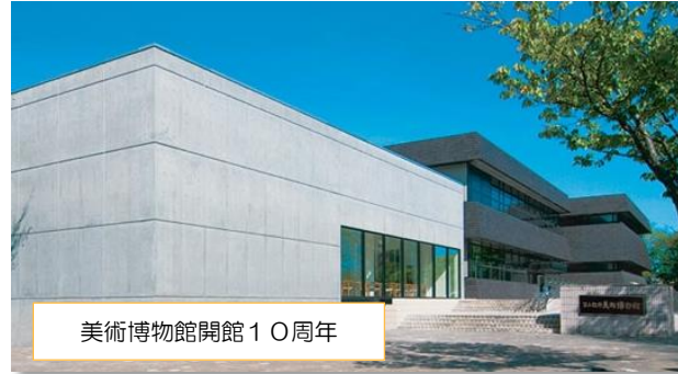
美術博物館開館10周年